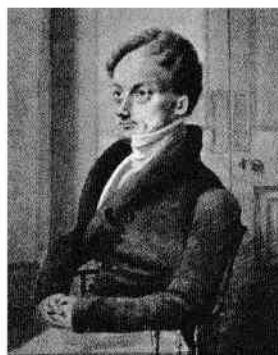
Portret al economistului, istoricului și filosofului James Mill, tată și preceptor al lui John Stuart Mill.

să mă învețe și fusese dispus să ofere truda și timpul necesar; că nu era niciun motiv de laudă pentru mine dacă știam mai mult decât cei care nu avuseseră un avantaj similar, dar aș fi meritat disprețul cel mai profund dacă nu știam. 2